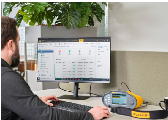
Einfache Datenverwaltung und Berichterstellung für elektrische Anlagen mit der TruTest Software

Der Fluke 1674 FC enthält die patentierte Isolationsvorprüfung. Damit können Sie die Installation besser schützen und teure Fehler vermeiden. Wenn der Installationstester erkennt, dass Geräte während der Prüfung mit der Installation verbunden sind, stoppt er die Isolationsprüfung und warnt Sie optisch und akustisch. Dadurch werden versehentliche Schäden an Peripheriegeräten vermieden, und Sie sparen Zeit und Geld.