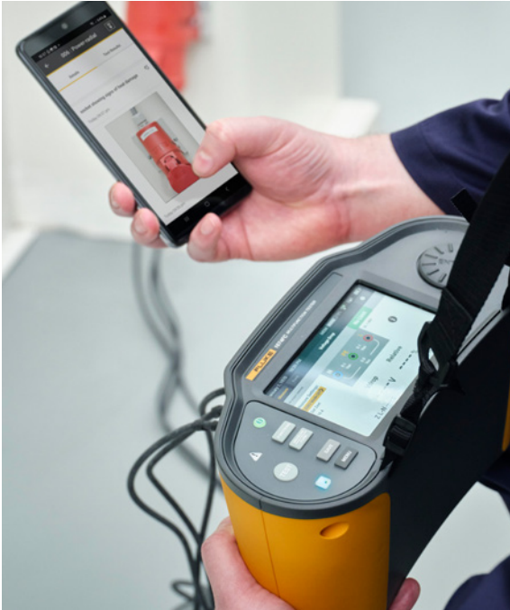
Sie können Fotos direkt bestimmten Messpunkten zuordnen, um diese genauer zu dokumentieren.