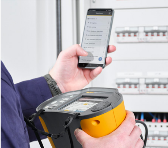
Weniger manuelle Dateneingabe und Aufzeichnungen